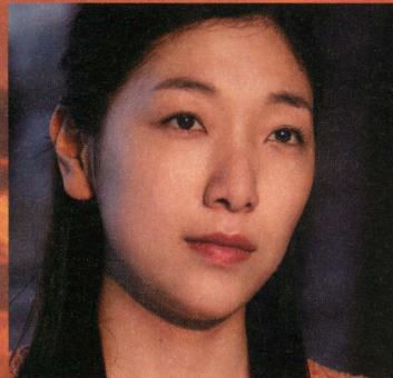
喫茶「ゆきわりそう」店主・仁科涼子 安藤 サクラ