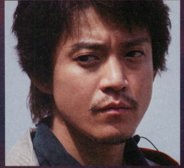
容疑者・田所啓太 小栗 旬