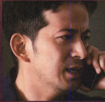
刑事・四方 篤 岡田 准一