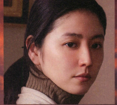
別居中の篤の妻・四方美那子 長澤 まさみ