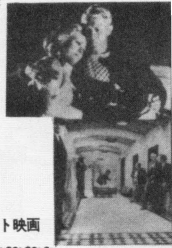
アカデミー主題歌受賞

スチーブ・マックイーン/フェイ・ダナウェイ 監督ノーマン・ジュイソン 音楽ミシェル・ルグラン