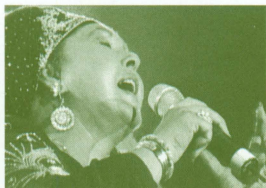
エスマ (マケドニア) バルカン・ミュージック界の歌姫