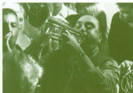
ファンファーラ・チョクルリア (ルーマニア) エミール・クストリッツァ監督の『アンダーグラウンド』や『ボラット』でも注目された超絶ジプシー・ブラス・バンド