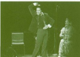
アントニオ・エル・ピバ・フラメンコ・アンサンブル (スペイン) フラメンコ界のスター