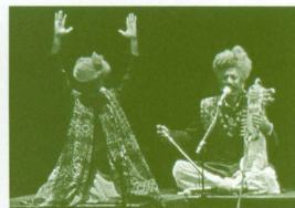
マハラジャ (インド) ジプシー発祥の地北インド・ラジャスターン出身のボーカルグループ