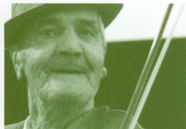
タラフ・ドウ・ハイドウクス (ルーマニア) ジョニー・デップも大ファンだという、天下無敵のジプシー義賊楽団