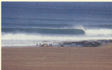
Uren, yeah, # 2 / Africa, / photo: Thomas Campbell