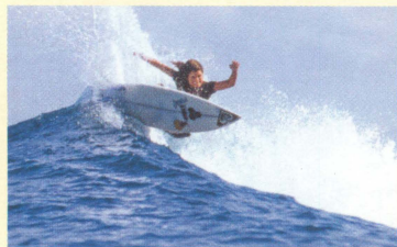
Sofia Lip Lacerator / Sumatra

『The Present』が示すもの。 それは、この美しく神秘的な水の惑星に行く、 多種多彩な現代のサーフィンの旅である。