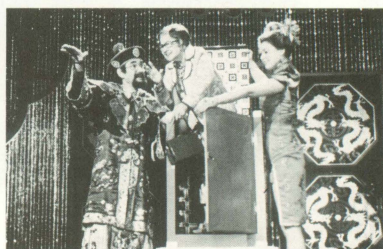
第3話 ■ウディ・アレン監督作品

<STAFF> 監督 ■フランシス・コッポラ / 脚本 ■フランシス・コッポラ & ソフィア・コッポラ / 製作 ■フレッド・ルース & フレッド・フックス / 撮影 ■ビットリオ・ストラロー, A.I.C., <CAST> ゾイ ■ヘザー・マコブ / クラウディオ (父) ■ジャンカルロ・ジャンニーニ / シャーロット (母) ■タリア・シャイア