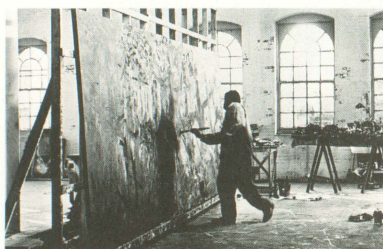
第1話 ■マーチン・スコセッシ監督作品

ザー」「地獄の黙示録」のフランシス・コッポラ。脚本は、彼と愛娘ソフィア・コッポラの共同。撮影は「地獄の黙示録」「ラストエンペラー」のビットリオ・ストラロー。第三話は才人ウディ・アレンの監督・脚本・主演。撮影はアカデミー賞3回受賞のスペン・ニクビスト。共演がW・アレンとは9回目のミア・ファロー。(上映時間2時間4分)