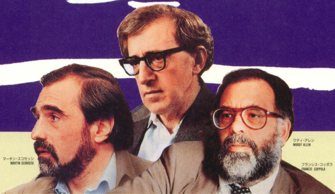
マーチン・スコセッシ MARTIN SCORSESE