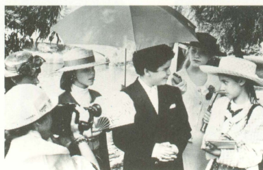
第2話 ■フランシス・コッポラ監督作品

<STAFF> 監督 ■マーチン・スコセッシ / 脚本 ■リチャード・プライス / 製作 ■バーバラ・デフィーナ / 撮影 ■ネスター・アルメンドロス, A.S.C., <CAST> ライオネル・ドビー ■ニック・ノルティ / ポーレット ■ロザンナ・アークェット