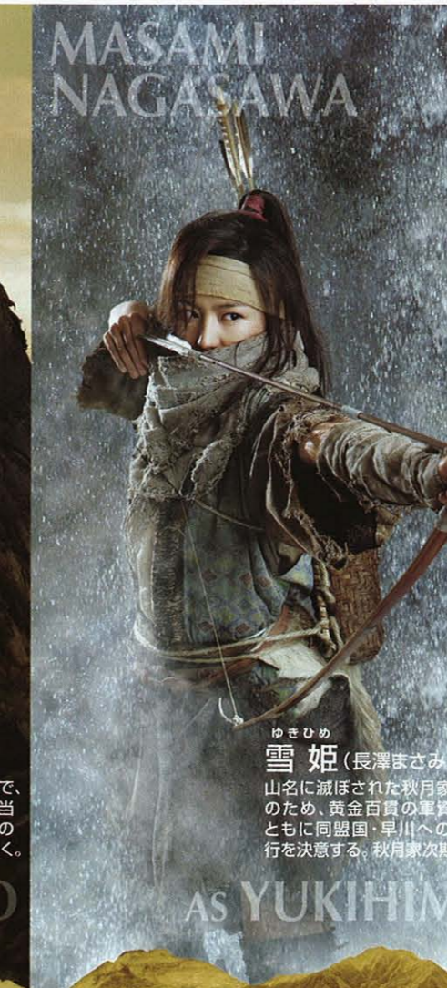
ゆきひめ 雪姫 (長澤まさみ) 山名に滅ぼされた秋月家再興のため、黄金百貫の軍資金とともに同盟国・早川への逃避行を決意する。秋月家次期当主。