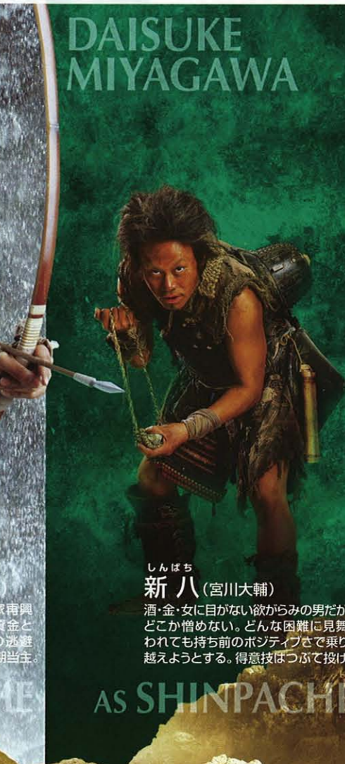
しんぱち 新八 (宮川大輔) 酒・金・女に目がない欲がらみの男だが、どこか憎めない。どんな困難に見舞われても持ち前のポジティブさで乗り越えようとする。得意技はつづて投げ。