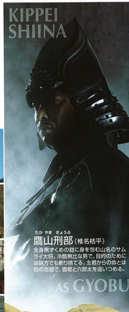
たかやま ぎょうぶ 鷹山刑部 (椎名桔平) 全身黒ずくめの鎧に身を包む山名のサムライ大将。冷酷無比な男で、目的のためには味方でも斬り捨てる。主君からの命とは別の思惑で、雪姫と六郎太を追いつめる。

日本映画史にその名を刻み、世界の才能をも唳らせた冒険活劇の傑作を、「日本沈没」「ローレライ」の樋口真嗣がエネルギーに甦らせる。『隠し砦の三悪人 THE LAST PRINCESS』超弩級のスリルとアクションが疾走する、まさにエンタテインメントの最高峰。