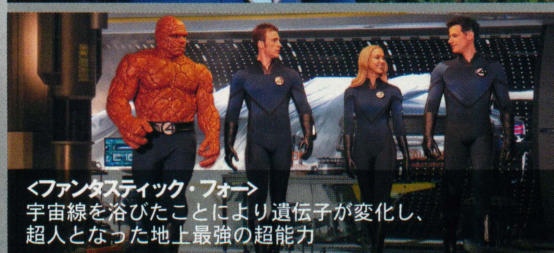
＜ファンタスティック・フォー＞ 宇宙線を浴びたことにより遺伝子が変化し、 超人となった地上最強の超能力