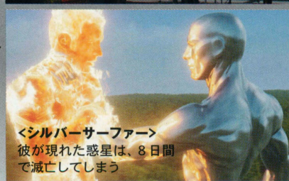
＜シルバーサーファー＞ 彼が現れた惑星は、8日間で滅亡してしまう