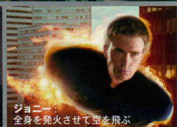
ジョニー： 全身を発火させて空を飛ぶ