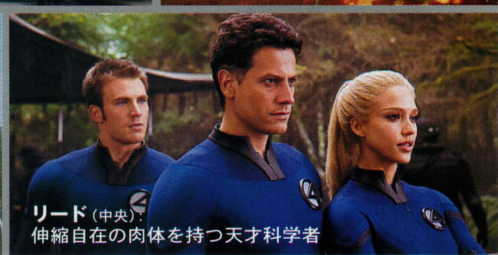
リード(中央)： 伸縮自在の肉体を持つ天才科学者