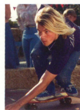
ジェイ・アダムズ (エミール・ハーシュ)

物静かで、思慮深い柱のような存在。その堅実さゆえに、メンバーとの疎外感を感じながらも、静かな闘志を燃やす。スケートボードとカルチャー、ビジネスを結びつけた最初の1人。