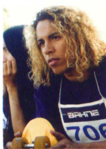
トニー・アルヴァ (ヴィクター・ラサック)

情熱的でアグレッシブな魅力溢れるトニーは、真っ先に人気スターになっていく。現在の垂直に飛び上がる“パート・スタイル”を生みだし、初代世界チャンピオンに輝いた。“スケートボード界のチャック・ベリー”と呼ばれるようになる。