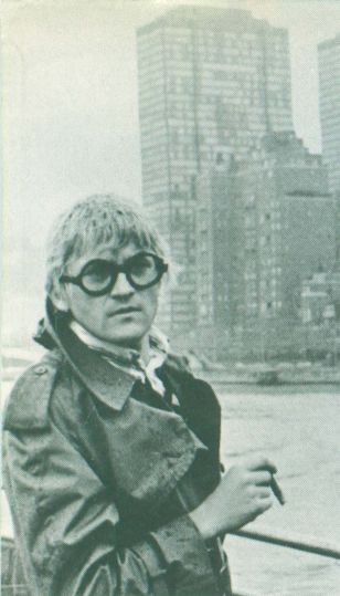
ある画家の肖像—これはホックニーが語ったホックニーだ。(タイムズ紙)