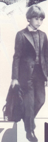
マーティン・シーン