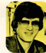
監督 ジョン・バダム

一時期の闘病生活を克服し、それ以降のモーレツな活動ぶりは目を見張らせるものがある。