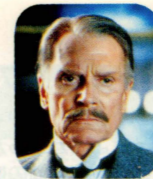
ローレンス・オリビエ