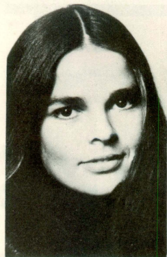
ALI MACGRAW as Jennie Cavillieri

知的な容姿とエキゾチックなムードをもつ女優でニューヨーク生れ。大学で美術、演劇を専攻。卒業後モデルとして一流誌のグラビアを飾ったが、「さよならコロンバス」で映画デビューし続く「ある愛の詩」で人気スターとなる。72年「ゲッタウェイ」で共演したステイブ・マックィーンと結婚、一児がある。