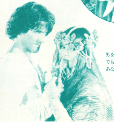
男を愛してはいけない掟です。 でも、愛しました。 あなたの純粋さと真心のために。