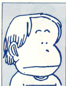
●いしいひさいちの マンガによる自画像

若者の間で人気No.1といえはこ の人。いまや若者文化の一大エポ ック・メーカーとなった。極度の マスコミ嫌い、めつたにその素 顔を見せないことで有名だ。 年令28歳。なかなかの好青年、 恥かしがり屋で、もの静か。いつ もヨレヨレのジーパンをはいてい る。